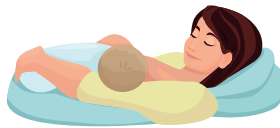
Laid Back Position