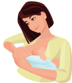
Modifizierte Wiegehaltung (Kreuzhaltung)