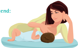
Stillen im Liegen (Seitenlage)